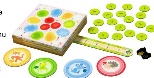
Rozložení hry pro 1–4 děti:

Položte 5 dílků cesty do řady před dort. Postavte havrana Thea před první dílek cesty v řadě. Zamíchejte dílky s ovocem tak, aby ovoce nebylo vidět, a rozložte je vedle cesty podle obrázku. Rozložte všechny plátky ovoce po místnosti tak, aby byly dobře viditelné, např. položte 1 plátek jablka do rohu místnosti, 1 plátek hrušky vedle pohovky a 1 plátek švestky na židli.